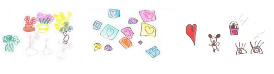
Fig 1. Dibujos de niñas – 5/6 años Fuente propia, 2008

Las interacciones constantes de los niños/as, dentro y fuera de las escuelas, con estos repertorios imagéticos se evidencian en sus producciones imagéticas – dibujos, pinturas, colajes, montajes tridimensionales - cuando ellas intentan transferir estas imágenes para sus producciones.